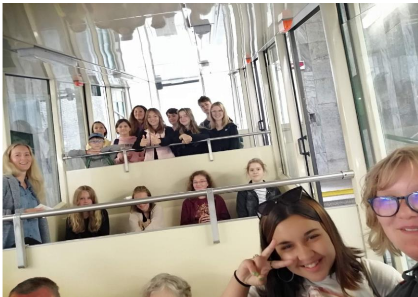
Lanovka na Petřín