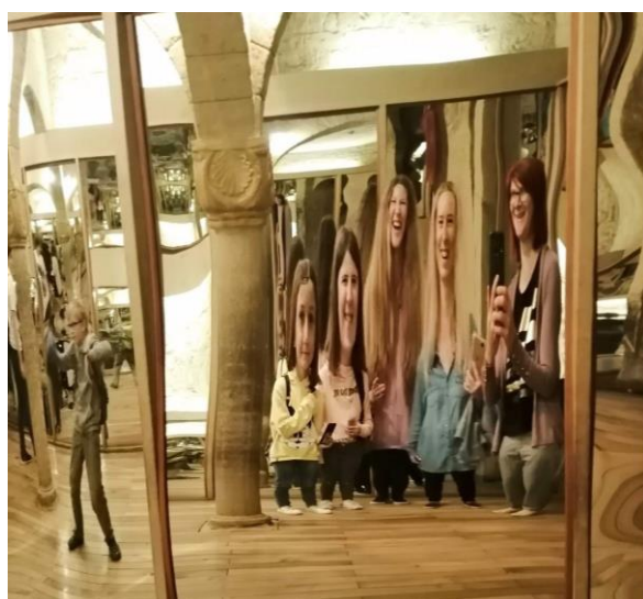
Zrcadlové bludiště (výlet parlamentu)