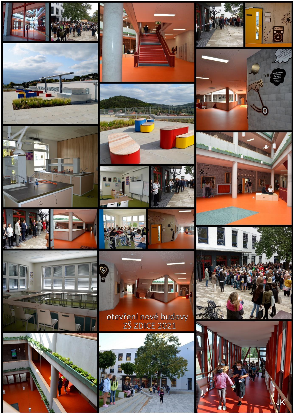
otevření nové budovy ZŠ ZDICE 2021